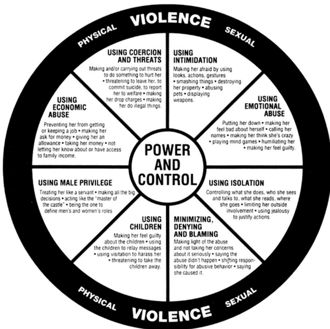
2 paveikslas. Duluth Domestic Abuse Intervention Project. Power and Control Wheel.

Wheel, http://www.theduluthmodel.org/training/wheels.html ), kuriame nurodoma, kokiais būdais prieš moteris yra naudojama vyro galia ir kontrolė.